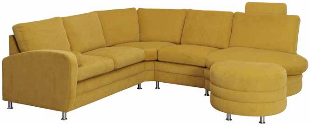
PALERMO Y-O-Q-N-K+L (M/DUNTOP)